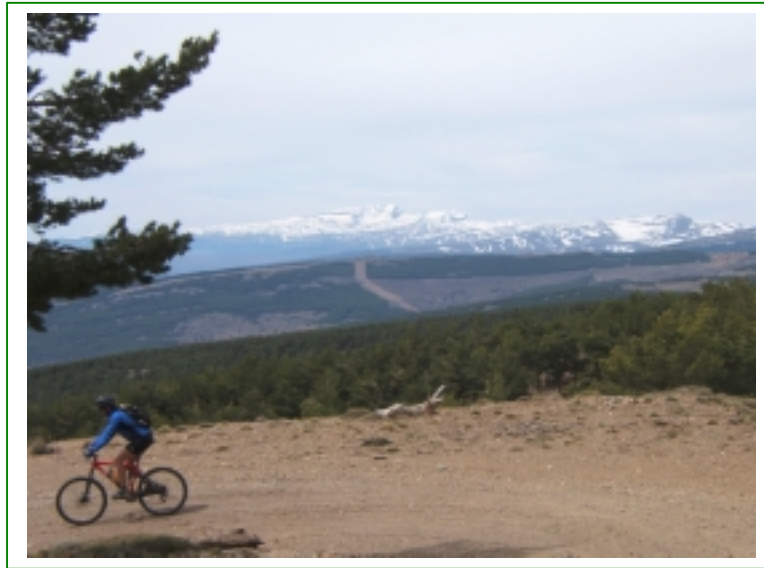
Mulhacén v Alcazaba.