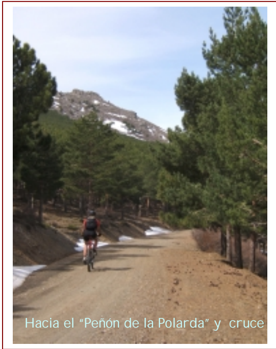
Hacia el "Peñón de la Polarda" y cruce