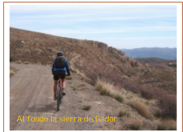
Al fondo la sierra de Gádor