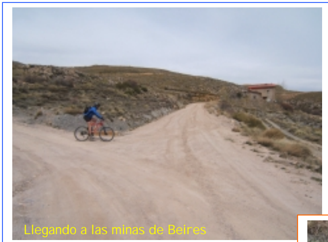
Llegando a las minas de Beires