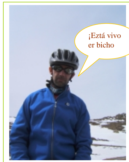
¡Eztá vivo er bicho

Algunas fotografías del ascenso hasta el cruce bajo el Buitre.