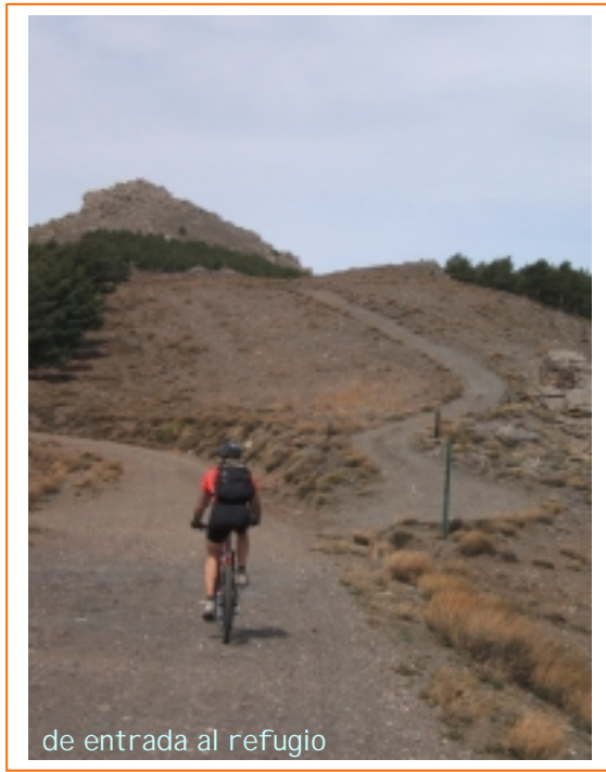
de entrada al refugio