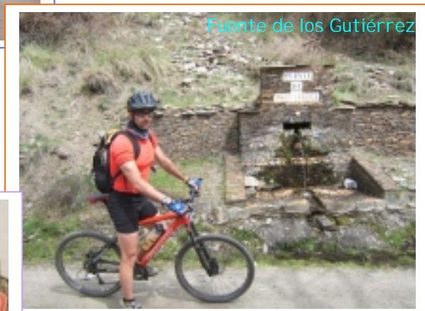
Fuente de los Gutiérrez