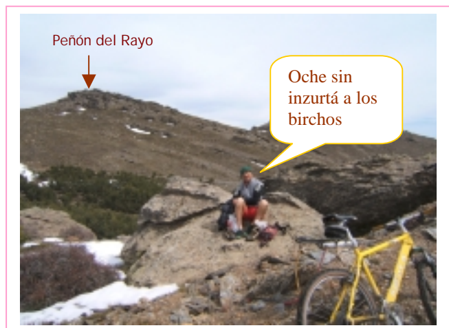
Peñón del Rayo

Algunas fotografías del ascenso hasta el cruce bajo el Buitre.